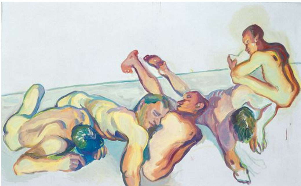
Maria Lassnig, Schlafende Männer